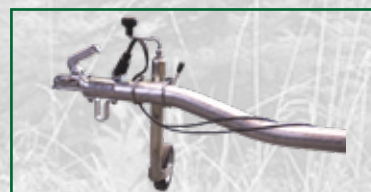
Abnehmbare Deichsel mit Stützrad

Alle Preise verstehen sich netto zzgl. der gesetzlichen MwSt. und Versandkosten.