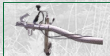
Abnehmbare Deichsel mit Stützrad

Alle Preise verstehen sich netto zzgl. der gesetzlichen MwSt. und Versandkosten.