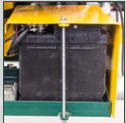
Batterie 12 V / 60 Ah