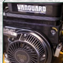
Motor mit Elektrostarter, 13 PS