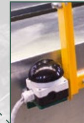
2-Hand – Bedienung des Greifers für eine sichere Vor – und Zurückfahrt