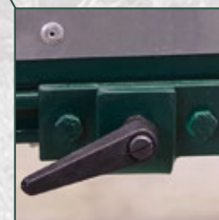
Längeneinstellung für Einzuglänge