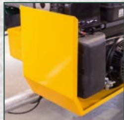
Motorabdeckung aus stabilem Kantblech